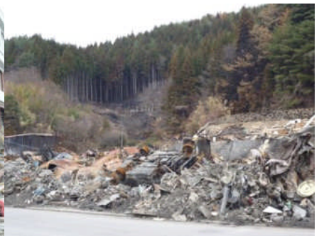
津波は沢を駆け上がった