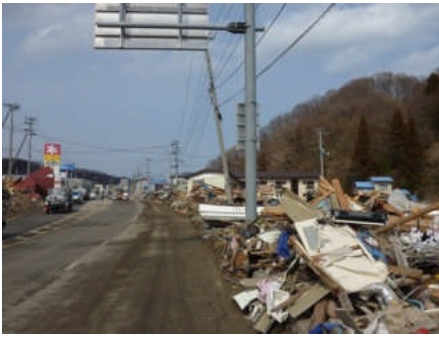
宮古市郊外国道 45 号線沿い