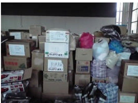
寄せられた支援物資(大槌町臨時役場)