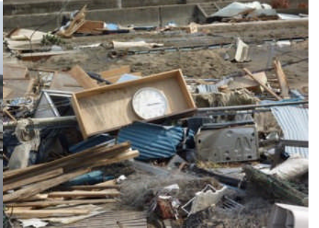
津波で流された時計