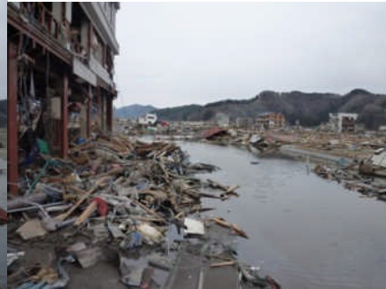
河岸の破壊された建物(大槌町)