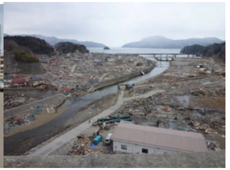
壊滅した集落(山田町、三陸道路高架橋から)