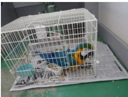
保護されたオウム(宮古市の動物病院)