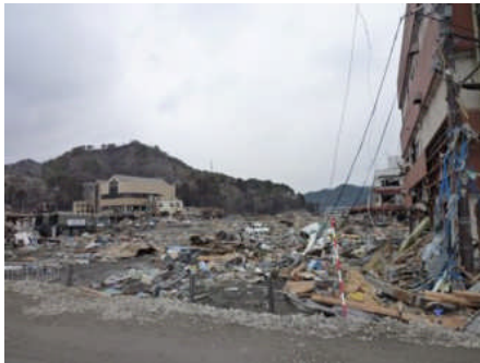
廃墟となった町並み