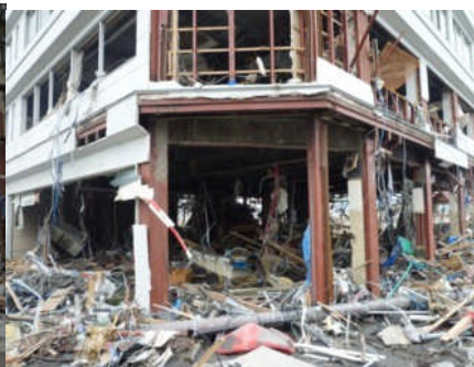
破壊された中心部の店舗