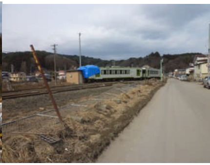
くの字型に脱線した機関車(山田線)