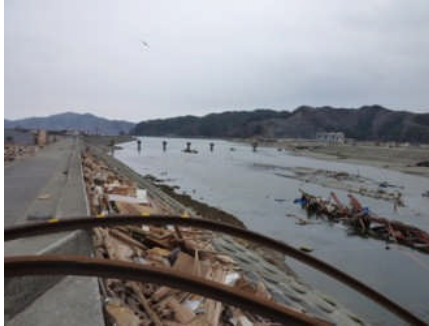
橋脚だけが残された(大槌川)