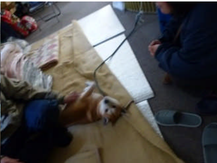
ロンちゃん(大槌町中央公民館の避難所)