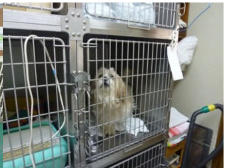
動物病院に避難していた犬 02(前同)